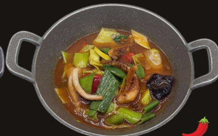
103 MINI WOK CALAMARI Calamari, cipolla, porro, funghi, peperoni, piccante.