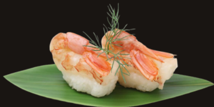
★ 314 NIGIRI AMAEBI 2PZ Riso, gambero rosso