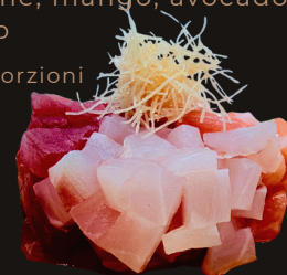
193 TARTARE DI MISTO Salmone, tonno, branzino, salsa dello chef