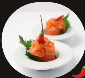
166 GUNKAN SPICY SAKE Riso, salmone piccante, tobico, salsa piccante.