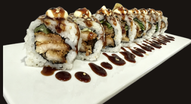
263 CHICKEN ROLL Riso, pollo fritto, insalata, salsa teriyaki , maionese, sesamo.