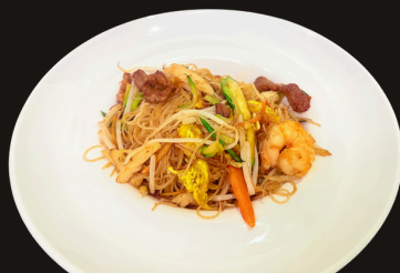
50 SPAGHETTI DI RISO MISTO Spaghetti di riso gamberi, verdure, pollo, manzo