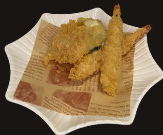
120 TEMPURA MISTA Tempura di gamberi e verdure