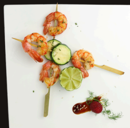
131 SPIEDINI DI GAMBERI Gamberi