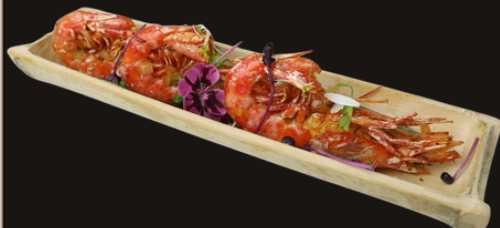
86 GAMBERONI SALE E PEPE Gamberoni fritti, cipolla, peperone, sale e pepe, spezie.