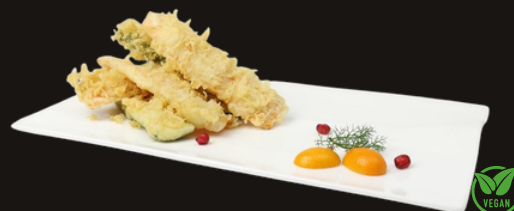
121 TEMPURA DI VERDURE Verdure fritte miste