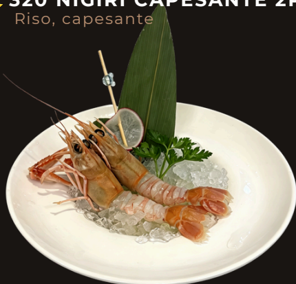
★ 322 SCAMPI 2PZ di scampi