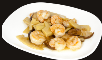
83 GAMBERI FUNGHI E BAMBU Gamberi, funghi, bambù