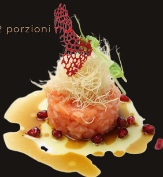
190 TARTARE DI SALMONE Salmone, kataifi, salsa dello chef