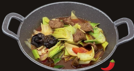
104 MINI WOK MANZO Manzo, cipolla, porro, funghi, peperoni, piccante.