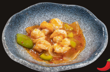
84 GAMBERI GONGBAO Gamberi, cipolla, peperoni, arachide