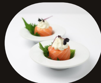
168 GUNKAN GIO Riso, philadelphia