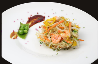
49 SPAGHETTI DI RISO CON GAMBERI Spaghetti di riso gamberi, verdure miste, uova