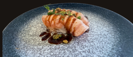
158 NIGIRI SAKE FLAMBÉ Riso, salmone scottato, latte condensato, pistacchio, salsa teriyaki.