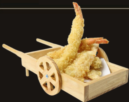
119 TEMPURA DI GAMBERI 3PZ Gamberi fritti in tempura