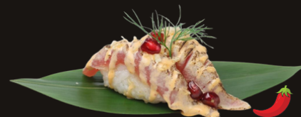
157 NIGIRI TONNO SCOTTATO Riso, tonno scottato, spicy maio, polvere di tempura.