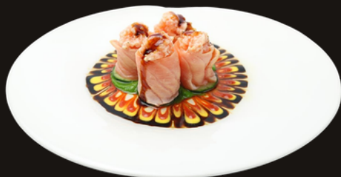
★ 310 GUNKAN FUOCO Riso, salmone, cetriolo, salsa teriyaki.