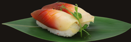
★ 321 NIGIRI HOKKIGAI 2PZ Riso, hokkigai