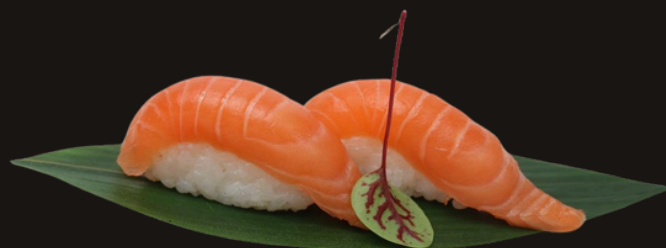
150 NIGIRI SAKE Riso, salmone