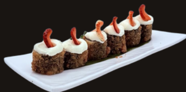
229 HOSOMAKI FRAGOLA Riso, salmone, philadelphia, fragola