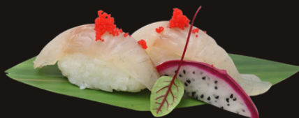
153 NIGIRI SUZUKI Riso, branzino