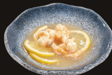
82 GAMBERI AL LIMONE Gamberi, limone