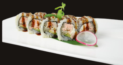
241 URAMAKI MIURA Riso, salmone fritto, avocado, salsa teriyaki, philadelphia, sesamo.