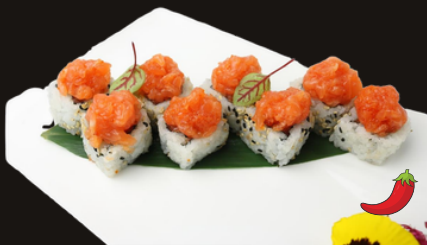
267 VULCANO ROLL Riso, salmone piccante, avocado, tobico, spicy maio.