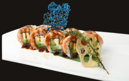
264 PHILA TOP Riso, avocado, philadelphia, salmone, salsa teriyaki, polvere di tempura.