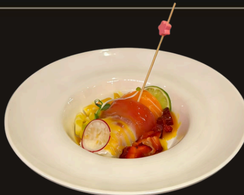
★ 317 CARPACCIO DI BUFALA Salmone, branzino, tonno, mozzarella di bufala, mango, fragola, salsa mango