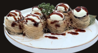
230 HOSOMAKI KATAIFI Riso, salmone, philadelphia, kataifi, teriyaki.