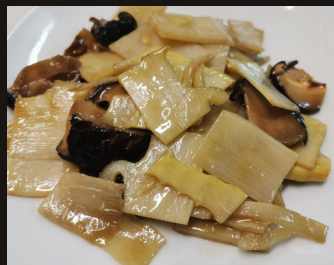
99 FUNGHI E BAMBU SALTATE Funghi, bambu