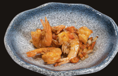
85 GAMBERI SALE E PEPE Gamberi fritti, cipolla, peperone, sale e pepe, spezie.