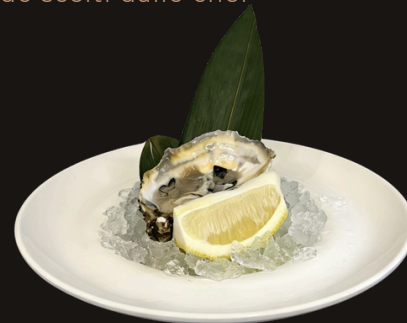
★ 315 OSTRICHE 1PZ di Ostriche