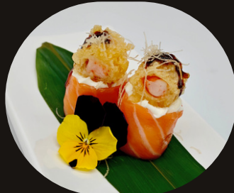
170 GUNKAN EBI GIO Riso, philadelphia, mango, salsa mango