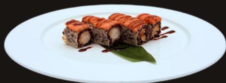
226 HOSOMAKI BLACK Riso venere, foglio di soia, gambero fritto, salmone esterno