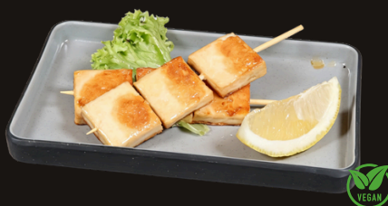
130 SPIEDINI DI TOFU Tofu di pesce