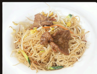
48 SPAGHETTI DI RISO CON MANZO Spaghetti di riso, manzo, verdure miste, uova.