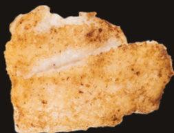
135 BRANZINO ALLA PIASTRA Branzino alla piastra