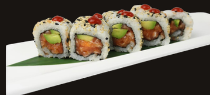
242 URAMAKI SPICY SAKE Riso, salmone piccante, avocado, sesamo, tobico, salsa spicy.