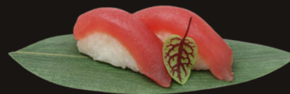
151 NIGIRI MAGURO Riso, tonno