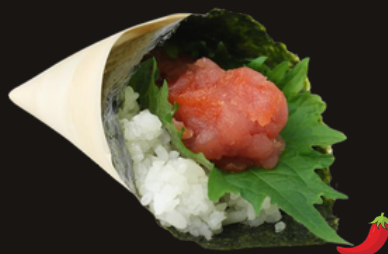
303 TEMAKI SPICY MAGURO Riso, tonno piccante, tobico, spicy maio.