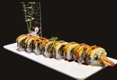
268 CHEESE ROLL Riso, gamberi fritti ,formaggio, salsa teriyaki