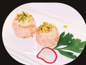
174 GUNKAN SALMONE FLAMBÉ Riso, salmone scottato, latte condensato, pistacchio, salsa teriyaki.