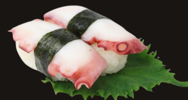
154 NIGIRI POLPO Riso, polpo