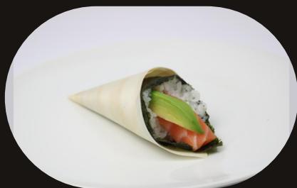
300 TEMAKI SAKE Riso, salmone, avocado.