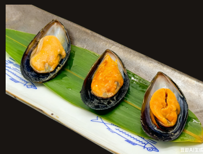
136 COZZE PIASTRA 3PZ cozze