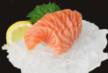
180 SASHIMI SAKE Salmone