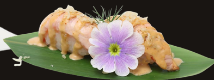
156 NIGIRI SAKE SCOTTATO Riso, salmone scottato, spicy maio, polvere di tempura.