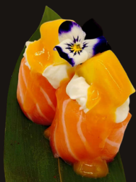
169 GUNKAN MANGO GIO Riso, philadelphia, mango, salsa mango