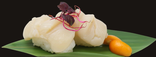
★ 320 NIGIRI CAPESANTE 2PZ Riso, capesante