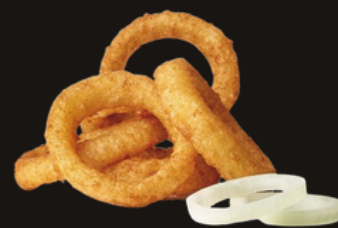
125 ANELLI DI CIPOLLA FRITTI Cipolla fritta