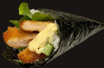
304 TEMAKI CHICKEN Riso, pollo fritto, insalata, maionese, salsa teriyaki.