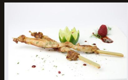
132 SPIEDINI DI POLLO Pollo