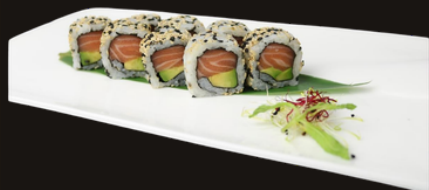
240 URAMAKI SAKE Riso, salmone, avocado, sesamo.