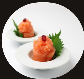
165 GUNKAN SAKE Riso, salmone