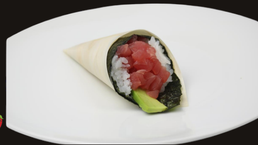
302 TEMAKI MAGURO Riso, tonno, avocado.