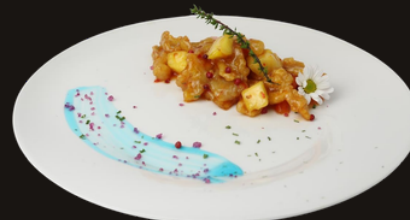
88 POLLO AGRODOLCE Pollo, ananas, pomodorini e salsa agrodolce