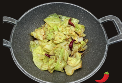
105 MINI WOK VERDURE Verza, piccante.