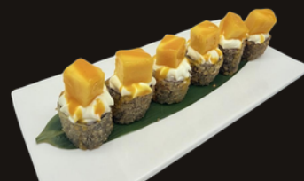
228 HOSOMAKI MANGO Riso, salmone, philadelphia, mango, salsa mango