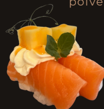
159 NIGIRI SAKE MANGO Riso, salmone con philadelphia, mango e salsa mango