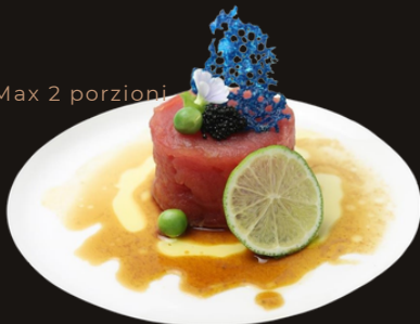
192 TARTARE DI TONNO Tonno, kataifi, salsa dello chef