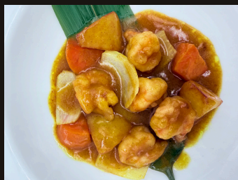
81 GAMBERI AL CURRY Gamberi, curry, cipolla, patate