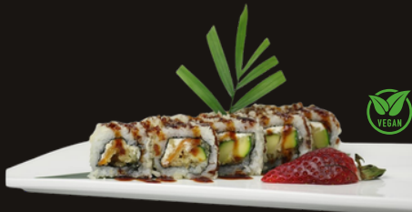
261 URAMAKI TEMPURA DI VERDURE Riso, verdure miste fritte, philadelphia, salsa teriyaki.