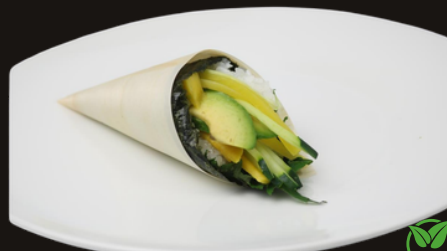
306 TEMAKI VEGETARIANO Riso, avocado, cetriolo, insalata.