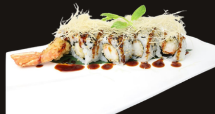
262 URAMAKI EBITEN Riso, gambero fritto, kataifi, salsa teriyaki,sesamo.