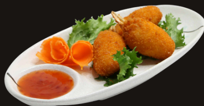
124 CHELE DI GRANCHIO Chele di granchio, pangrattato