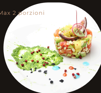
191 TARTARE DI SALMONE SPECIAL Salmone, mango, avocado e salsa mango