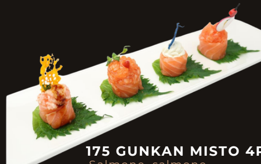
175 GUNKAN MISTO 4PZ Salmone, salmone scottato, philadelphia, salmone spicy.