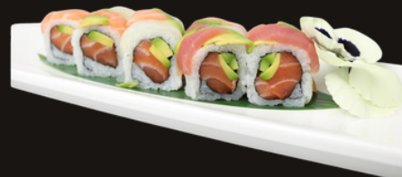
265 URAMAKI RAINBOW ROLL Riso, avocado, salmone, tonno, branzino.