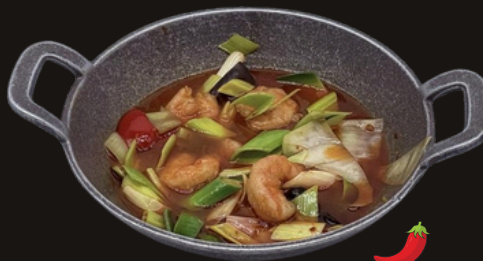
102 MINI WOK GAMBERI Gamberi, cipolla, porro, funghi, peperoni, piccante.