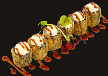
227 HOSOMAKI FRITTO Riso, salmone, philadelphia, teriyaki.