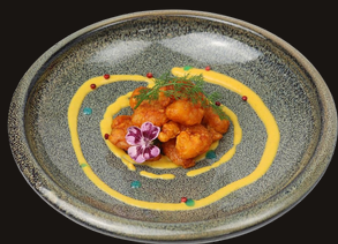
80 GAMBERI AGRODOLCE Gamberi, ananas pomodorini e salsa agrodolce