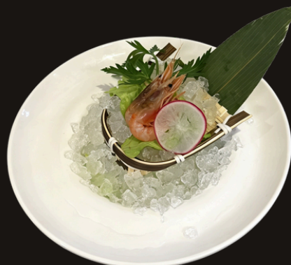
★ 323 GAMBERI ROSSI 2PZ di gamberi rossi