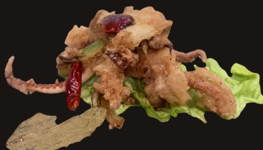
87 CALAMARI SALE E PEPE Calamari fritti, cipolla, peperoni, sale e pepe, spezie.