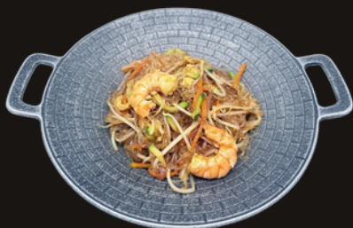
52 SPAGHETTI DI SOIA CON GAMBERI Spaghetti di soia, gamberi, verdure miste.