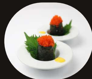
172 GUNKAN TOBICO Riso, alghe, tobico