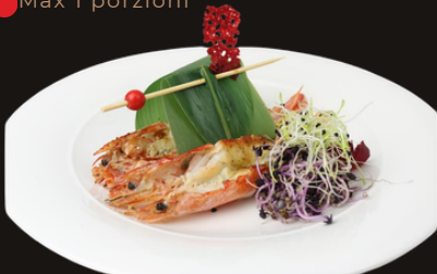
133 GAMBERONI ALLA PIASTRA Gamberoni , salsa teriyaki