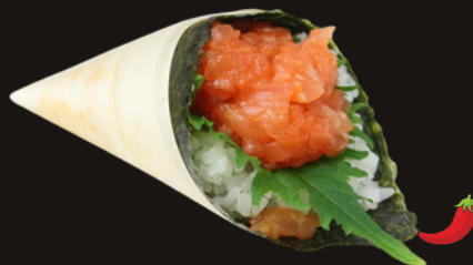
301 TEMAKI SPICY SAKE Riso, salmone piccante, tobico, spicy maio.