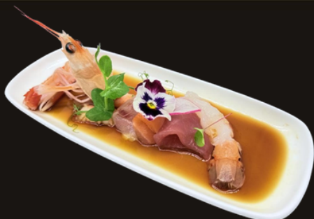
★ 316 CARPACCIO MISTO SPECIALE 5PZ Salmone, tonno, branzino, gamberi, scampi, salsa dello chef.

E' possibile ordinare solo 2 piatti tra i 12 proposti ★