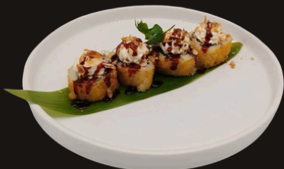
266 URAMAKI FRITTO Salmone, philadelphia, teriyaki, cipolla fritta