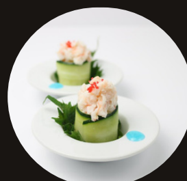
171 GUNKAN EBI Riso, cetriolo, gamberi cotti, maionese, tobico.