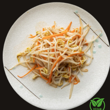
101 GERMOGLI DI SOIA Germogli di soia, carote.