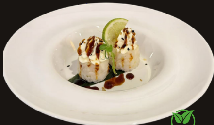
173 GUNKAN SNOW BALL Riso, philadelphia, sesamo salsa teriyaki.