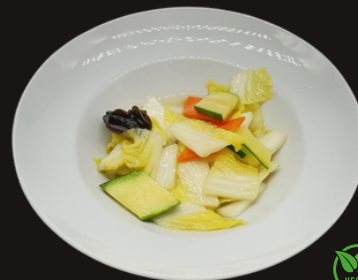
100 VERDURE MISTE SALTATE Verdure cinese, carote, zucchine, orecchi di legno