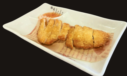
123 COTOLETTA DI POLLO Cotoletta di pollo fritto