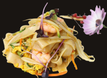
46 SPAGHETTI BATHAI Spaghetti bathai, verdure miste, gamberi, uova, salsa di limone.