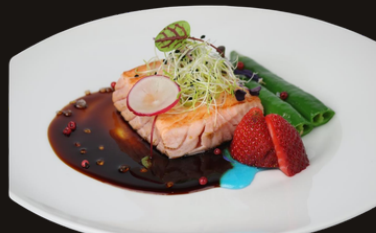
134 SALMONE ALLA PIASTRA Salmone alla piastra, teriyaki.