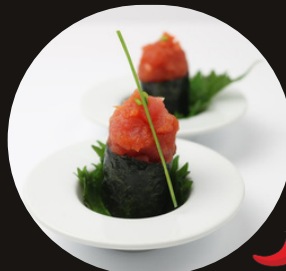
167 GUNKAN SPICY MAGURO Riso, alghe, tonno piccante, tobico.