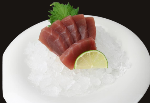
★ 181 SASHIMI MAGURO Tonno