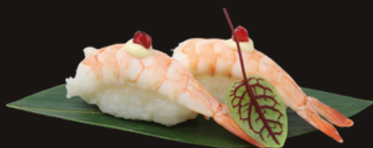
152 NIGIRI EBI Riso, gamberi cotti