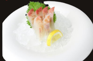
182 SASHIMI SUZUKI Branzino