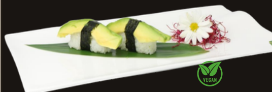
155 NIGIRI AVOCADO Riso, avocado