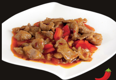
98 MANZO GONGBAO Manzo, cipolla, peperoni, arachide