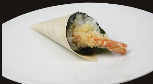
305 TEMAKI TEMPURA Riso gamberi, salsa teriyaki