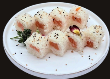
260 URAMAKI WHITE Riso, philadelphia, salmone, no alghe