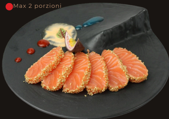
137 TATAKI SAKE 4PZ Salmone scottato in crosta di sesamo, teriyaki.