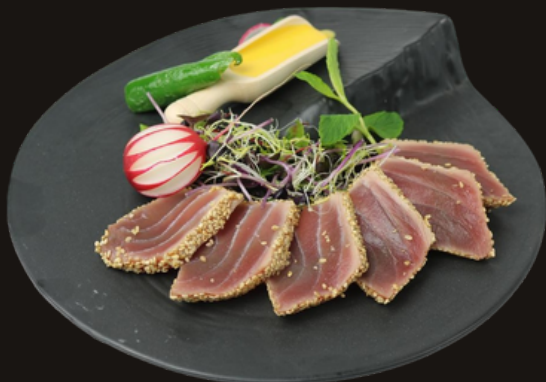
★ 138 TATAKI MAGURO Tonno scottato in crosta di sesamo, teriyaki.

E' possibile ordinare solo 2 piatti tra i 12 proposti ★